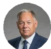
Вячеслав Петушенко Председатель правления Государственной компании «Российские автомобильные дороги»