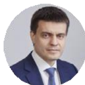
Михаил Котюков Губернатор Красноярского края