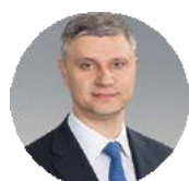
Олег Белозеров Генеральный директор – председатель правления ОАО «РЖД»