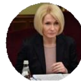
Виктория Абрамченко Заместитель председателя Правительства РФ по вопросам сельского хозяйства, экологии и оборота недвижимости, куратор в СФО