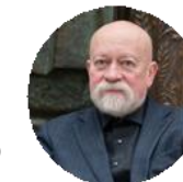
Николай Шумаков Президент Союза Архитекторов России, Союза Московских архитекторов, Народный архитектор России