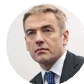
Виктор Евтухов Статс-секретарь – Заместитель министра промышленности и торговли Российской Федерации