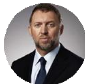
Олег Дерипаска Основатель компании «РУСАЛ»