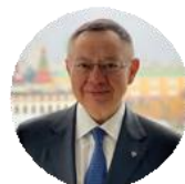
Ирек Файзуллин Министр строительства и ЖКХ