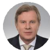
Виталий Савельев Министр транспорта Российской Федерации