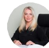
Александра Кузьмина Первый заместитель председателя Комитета по архитектуре и градостроительству, главный архитектор Московской области