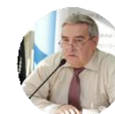
Виктор Новоселов Президент Союза Проектировщиков России