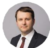
Максим Орешкин Помощник президента РФ