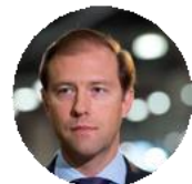
Денис Мантуров Заместитель Председателя Правительства, Министр промышленности и торговли Российской Федерации